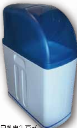
全自動再生方式 ナノバブル超軟水生成器