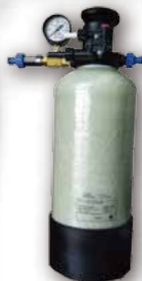
手動再生方式 ナノバブル超軟水生成器 NS-70MB