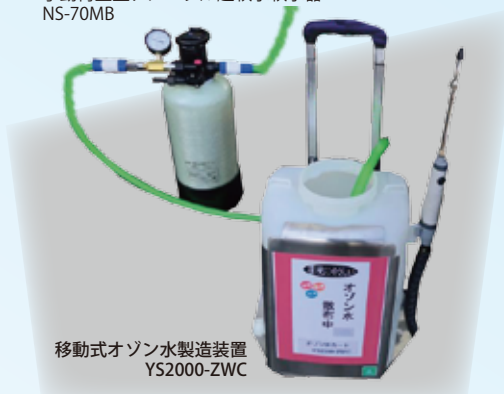
移動式オゾン水製造装置 YS2000-ZWC